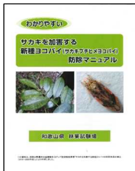
ヨコバイ防除マニュアル

近年、県内全域でサカキの葉に白点被害が発生し、産地の維持が懸念されている。原因は、新種ヨコバイ（サカキブチヒメヨコバイと命名）による吸汁痕であることが判明した。