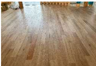
広川町地域交流センター施工状況

防腐、防蟻試験により、サーモ処理を施すことで耐朽性の向上が見られたが、防蟻性に対する効果は確認されなかった。また、屋外耐候性試験では造膜性の顔料系塗料による変色、割れの抑制効果が確認された。