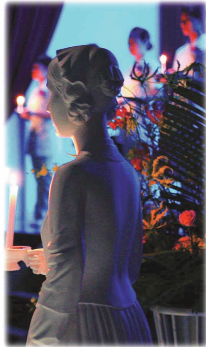
ナイチンゲール像